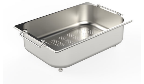
Passoire en acier inoxydable 8154 000