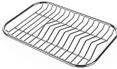
Grille porte-assiettes inox 8100 154