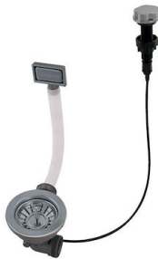
Vidange automatique Gun metal